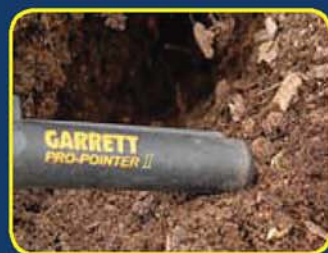
用CSI Pro-Pointer II 刮除土壤、樹葉等