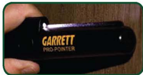
LED照明燈可於暗處使用