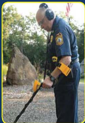
用 CSI 250 地下 金屬偵測器搜尋